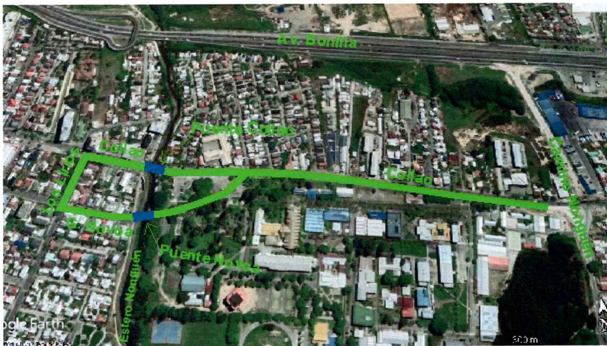
Figura 3: Ubicación del proyecto Etapa 2B

La ejecución de la Etapa 2B estuvo a cargo de la empresa Icafal Ingeniería y Construcción S.A., por un monto de $15.337.892.330, con inicio de obras el 16.03.2022 y término el 30.07.2024.