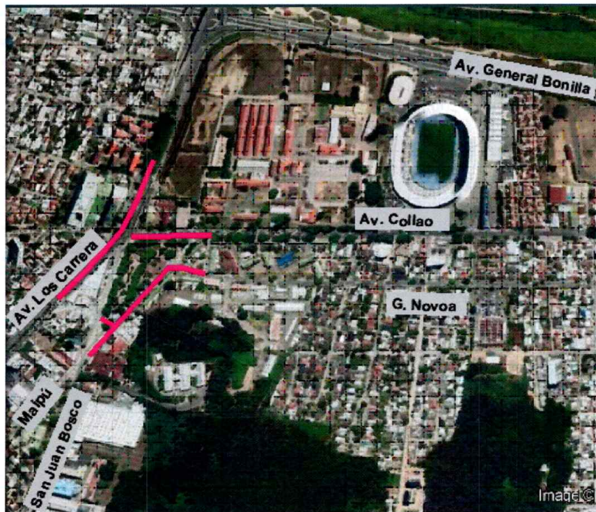
Figura 4: Ubicación del proyecto Etapa 2A

Su estado de avance a enero de 2025 es del 81%.