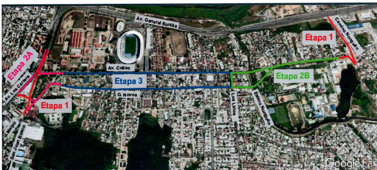
Figura 1: Ubicación del proyecto

En cuanto al corredor de buses por Avenida Collao, este inicia desde calle Paula Pineda (frente a la Universidad del Biobío), hasta antes del nudo Los Carrera-Collao-Juan Bosco. Al disponerse el corredor de buses por la pista central, el tránsito de vehículos ligeros va por los costados, lo que facilita los accesos vehiculares a las viviendas, sin interferir en el corredor de buses. Considera, además, la construcción de dos puentes sobre el Estero Nonguén, en la Avda. Collao, previa demolición del existente y uno nuevo en Avda. General Novoa.