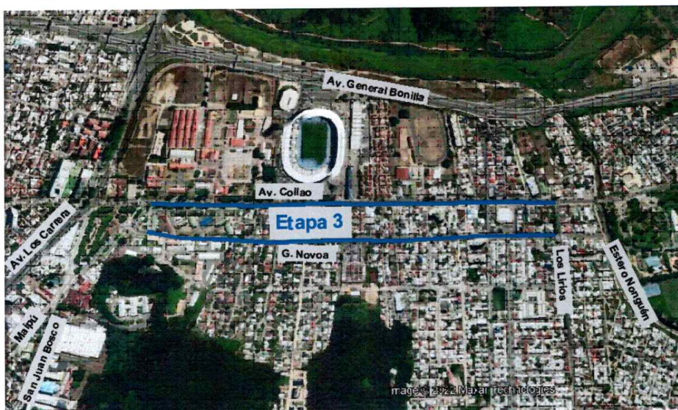
Figura 5: Ubicación del proyecto Etapa 3

Esperando dar respuesta al requerimiento realizado, saluda atentamente a Ud.,