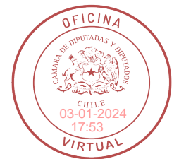
FIRMADO DIGITALMENTE: H.D. FELIPE CAMAÑO C.