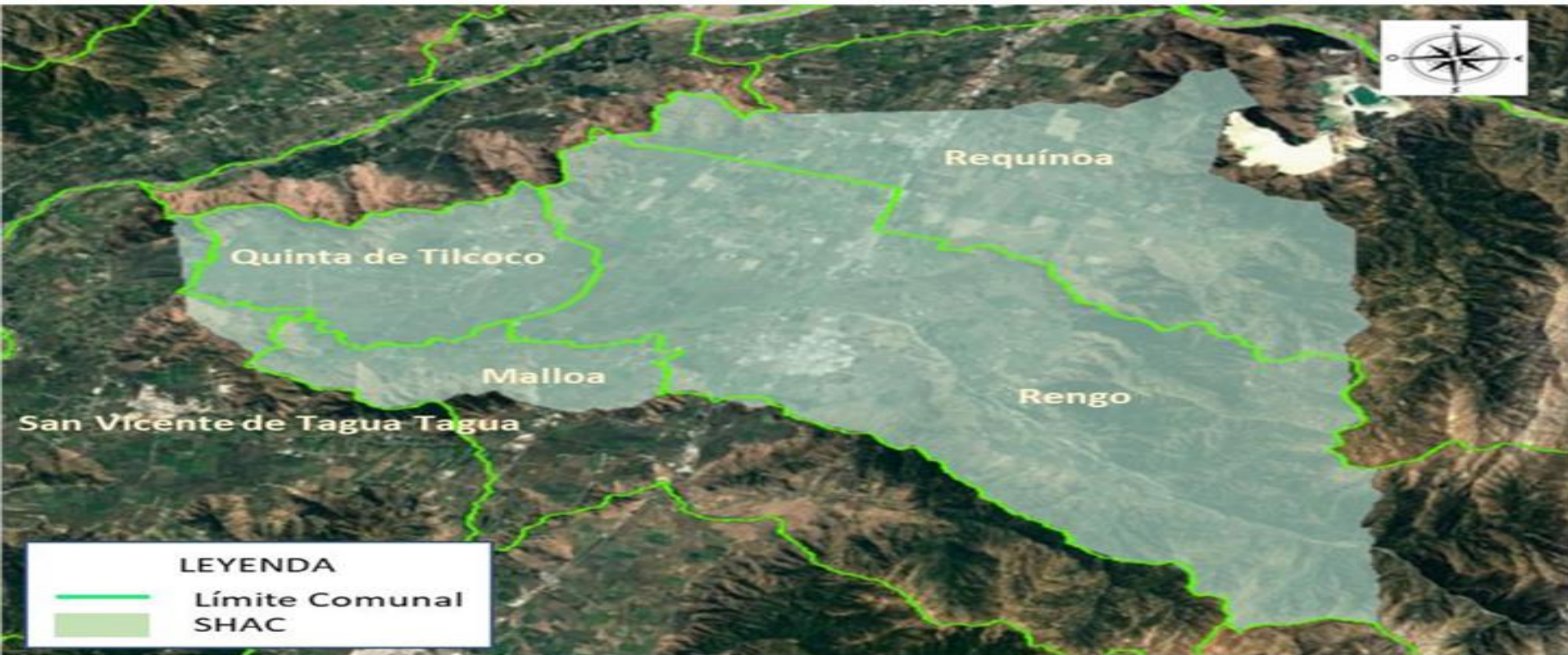
Imagen 2. Comunas contenidas en SHAC.