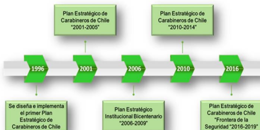
Diagrama de la Evolución Estratégica de Carabineros

De esta forma y como respuesta institucional para enfrentar las demandas de seguridad de la comunidad este PEDP consideró 04 Objetivos Estratégicos, 08 Ejes Estratégicos y 19 Programas, los cuales en su conjunto contribuirán a la materialización de la misión y visión institucional.