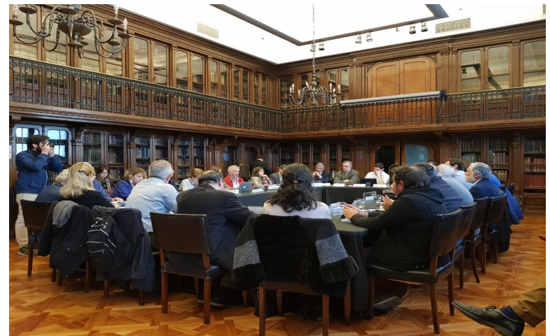
Mesas de Trabajo Proyecto Ley de Patrimonio Cultural Primer Plenario 26/08/2019 Sala Ercilla, Biblioteca Nacional de Chile