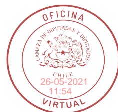
Cristóbal Urruticoechea Ríos H. Diputado de la República

“Asimismo, se prohíbe en la educación parvularia, básica y media el uso de alteraciones gramaticales y fonéticas que desnaturalicen el lenguaje dentro de la enseñanza oficial reconocida por el Estado”. ”.