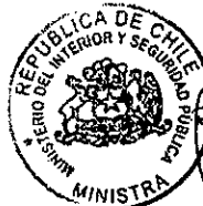
CAROLINA TOHÁ MORALES MINISTRA DEL INTERIOR Y SEGURIDAD PÚBLICA