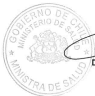
DRA. XIMENA AGUILERA SANHUEZA MINISTRA DE SALUD