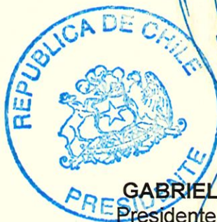
GABRIEL BORIC FONT Presidente de la República