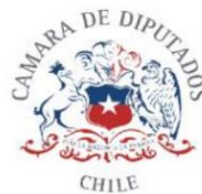
KAREN MEDINA VÁSQUEZ DIPUTADA DE LA REPÚBLICA

“En los casos excepcionales indicados en este artículo o cualquier otro incluyendo la declaración de estados de excepción constitucional, como es el de catástrofe, calamidad, u orden de autoridad. Ninguna entidad regida por la Ley N° 19.886 podrá celebrar contratos con empresas que tengan menos de treinta y seis meses de vigencia desde su constitución, que cuente con inicio de actividades, con la misma antigüedad y un ejercicio contable verificable. Estas condiciones deberán ser consideradas para cualquier tipo de licitación, o trato directo, siendo esenciales para la adjudicación. Para el perfeccionamiento de cualquier contratación en estas circunstancias, será requisito indispensable la aprobación del órgano competente en pleno de la entidad respectiva. En caso de incumplimiento de esta disposición, el acto jurídico celebrado será considerado nulo de pleno derecho (ipso facto), con las consecuencias legales correspondientes, y los funcionarios responsables, incluidos alcaldes, concejales, o sus equivalentes, serán solidariamente responsables del respectivo acto jurídico.”