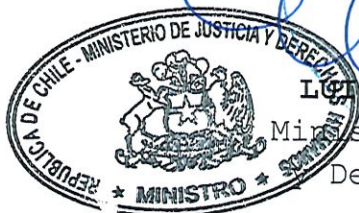
LUIS CORDERO VEGA Ministro de Justicia Derechos Humanos